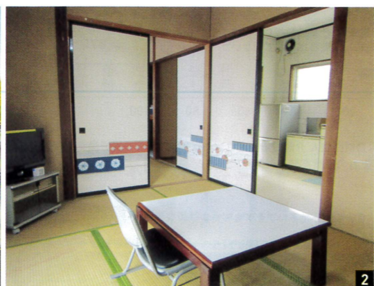
1施設外にある職員宿舎 2職員宿舎内観。ここで刑務所出所者等に一時的に滞在してもらう