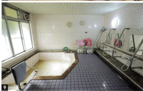
7 テレビ視聴やカラオケ大会など多数の催しも開催されている居住棟の談話室 8 日当たりが良く気持ちのいい居住棟廊下の談話室 9 広々としてシャワーも完備されている男女別大浴場