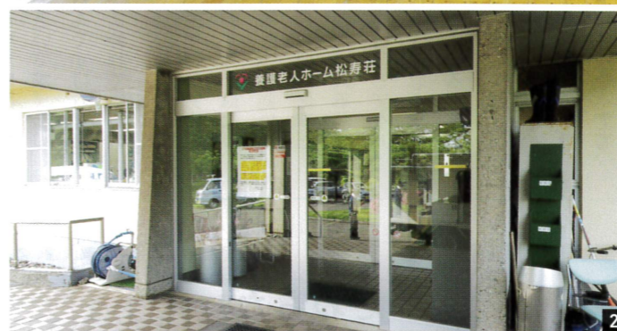
1 高齢者福祉施設では珍しい本格的な体育館。地元民の催し物にも開放している 2 管理棟のエントランス。この前には雨にぬれずに済む車寄せがある 3 エントランス内側。入ってすぐ左には受付がある。車椅子用のスロープも完備