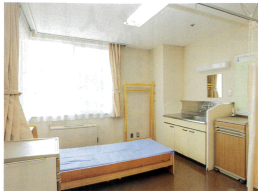
施設内にある刑務所出所者等の一時滞在部屋