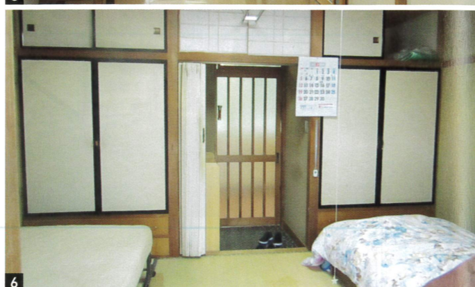
4 緑豊かな自然に恵まれた農山村地域となっている周辺環境 5 居住棟の廊下。玄関扉横には、常に防災頭巾が用意されている 6 居室は、畳やふすまなど純和風の造りとなっている